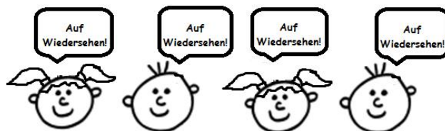
sagen alle Kinder.