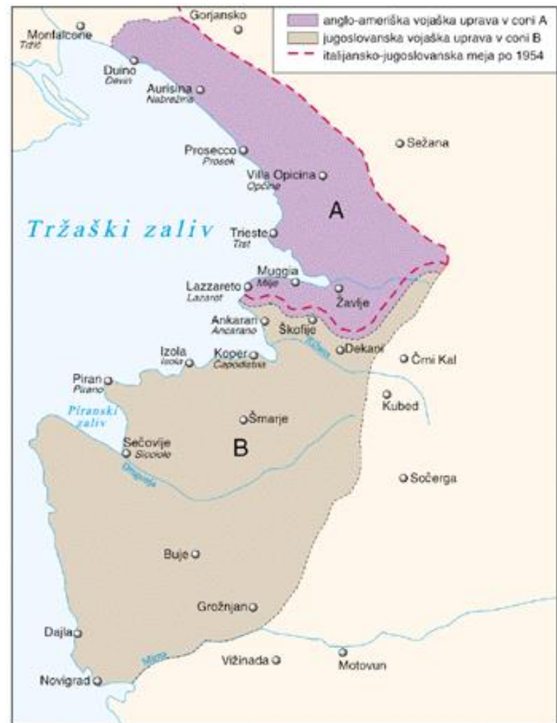
Zemljevid STO in njegova delitev prav tako na coni.

Za lažjo predstavo... zemljevid Cone A in cone B. Pod katerim nadzorom sta bili coni?