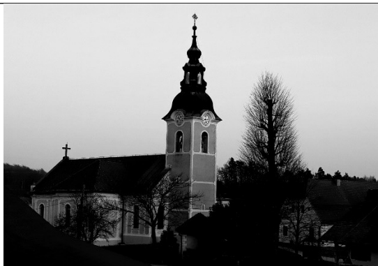
SVETLO - TEMNI KONTRAST