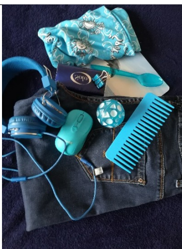
Vidno je dvoje: SVETLO - TEMNI KONTRAST ali TONI ENE BARVE