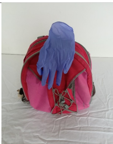
Vidno je dvoje: SVETLO - TEMNI KONTRAST ali TOPLO - HLADNI KONTRAST