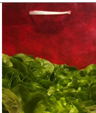
KOMPLEMENTARNI KONTRAST IN HKRATI KOLIČINSKI (RDEČA - ZELENA; 1:1)